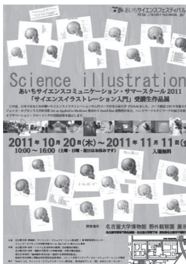
図 7. ポスター