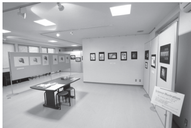
図 8. 展示会場の様子

この夏、日本ではなじみの薄いサイエンスイラストレーションの入門コースが名古屋大学で行われました。コース創設 100 周年を迎えた米国ジョンス・ホプキンス大学医学部 Art as Applied to Medicine 専攻から David Rini 准教授が来日。ハンドワークと PC ワークの両方を使ったオブザベーション・ドローイングの実践成果を展示します。