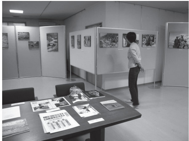
図4. 展示会場の様子