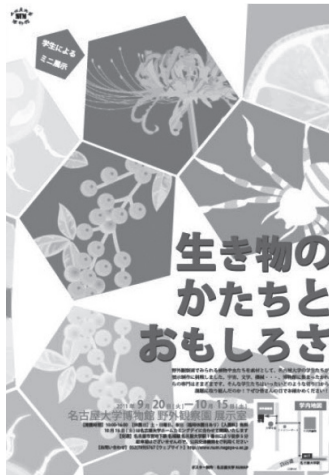
図 5. ポスター