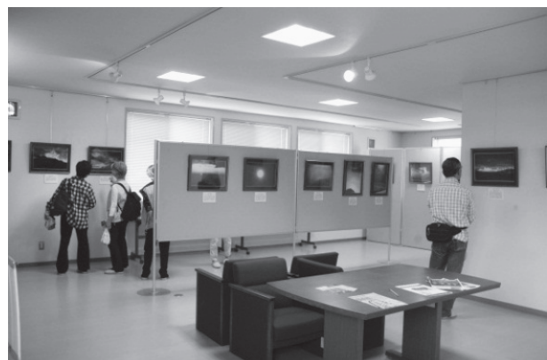
図2. 展示会場の様子