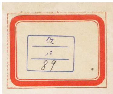
図1 南満洲鉄道株式会社庶務部調査課『満洲の通貨不信用の支那土着民及関係外国人に及ぼせる影響』見返しの蔵書ラベル

荒木文書への編入を進める際に大きな手掛かりになったのが、表紙や見返しの蔵書ラベルである。たとえば、南満洲鉄道株式会社庶務部調査課『満洲の通貨不信用の支那土着民及関係外国人に及ぼせる影響』（1929 年 10 月 20 日、資料 No.1041）には「金||パ||89」（図 1）が、同『1928 年独逸に於ける鉄鋼労働争議』（29 年 3 月、資料 No.1200）には「雑||パ||229」が添付されている。これらのなかには 2014 年の当初公開時にもその内容から荒木光太郎旧蔵と推定され、「荒木家寄贈の可能性の高い配架図書一覧」として明記していたものもあったが、何れも「荒木」印等は捺