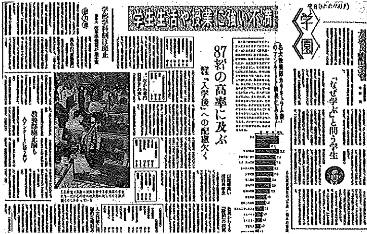
図2 中日新聞 (1970年5月11日夕刊)

大学の学業について、学生は投げ出してしまっているのではなく、一方では大変気にかけている。……(中略)……これに対応しようような教育・研究体制を考えることなしには、事態はもはや打開されえないところに来ているのではないか。本調査を生かす一つのポイントがここにあるように思われる。