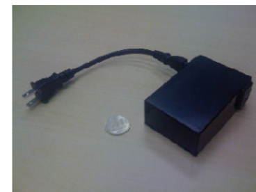
図 1 細粒度電力センサ Fig. 1 Fine-grained Watt Meter

コンセント単位で計測可能なことにより機器個別の消費電力変化を知ることができ、機器使