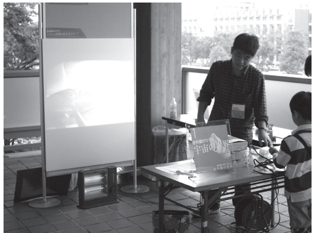
図3：2011年10月17日に実施した「触れて感じて学ぶ！赤外線の世界」の様様。左奥に赤外線カメラの画像が投影されている。

本コーナーでは肉眼では見えない赤外線を、赤外線カメラを通して参加者に見て体験してもらうことを導入とし、天文学における赤外線の利用法について学んでもらうことを目的とした。赤外線カメラは赤外線に感度を持つ市販のカメラと赤外線を通過するフィルタを用いて製作し、画像はリアルタイムにプロジェクタを用いて投影した(図3)。導入として、市販のキーライトを3つ準備し、うち1つのLEDを赤外線LEDに入れ替えたものを用いたクイズを実施した。これらを赤外線カメラに向け、肉眼では暗いままのキーライトが画面上では最も強く発光しているという発見を通じ、参加者が驚きというかたちで赤外線の存在を体感できることを目指した。次に、電熱線ストーブを用いて熱的放射や赤外線の高い透過性について扱う展示を作成した。赤外線源であるストーブに黒いポリビニルをかざし、そこを赤外線カメラで写すことで、肉眼では可視光を殆ど透過していないが、赤外線は透過していることが一見して分かることを利用している。同様に着火した線香も教材として用いている。続いて、星間ダストによる減光及び熱放射を示した図を用い、赤外線が天文学において重要な手法であることを示した。