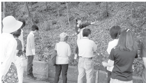
図1：2011年6月5日に実施したキャンパスガイドツアーの様相（東山キャンパス内の窯跡にて）

ハンズオンとは資料への接触や活動を通じ、参加者が体感的に学習することを目的とした展示手法である。参加者が自ら展示物に触れ、体験を重ねることにより、参加者の興味をより効果的に引き出すことが可能である。NUMAPでは「触れて感じて学ぶ！サイエンス」と題して、ハンズオン展示に解説パネルやスタッフとのコミュニケーションを加えていくことで、より深いレベルでの学問の理解・定着を図ってきた。本章では今年度実施した考古学ハンズオンイベントと赤外線ハンズオンイベントの概要について述べる。