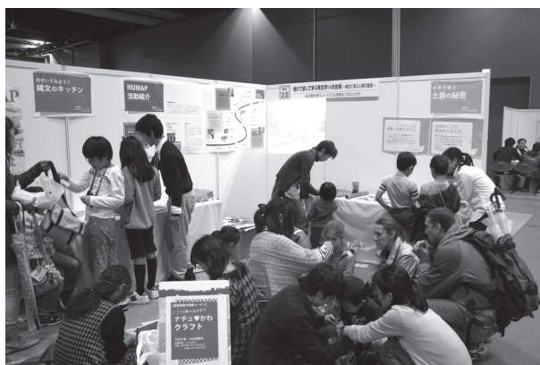
図2：2011年11月19日・20日に行われたサイエンスアゴラ2011におけるNUMAP出展ブースの様相。手前が製作体験コーナー、壁際左から石器ハンズオン「縄文のキッチン」、 「NUMAP活動紹介」、土器ハンズオン「ドキドキ！土器の秘密」。