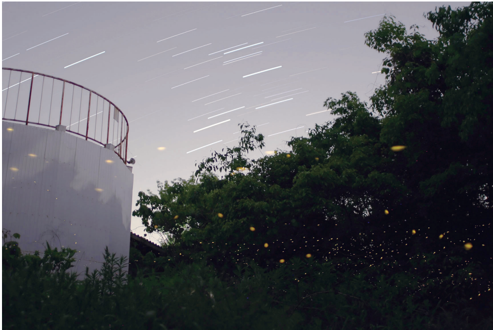
図 2. ポイント A におけるヒメボタルの飛翔 (ナショナルコンポジットセンター建設工事開始以前の 2010 年 5 月 21 日午後 11 時ごろ撮影, 合計露光時間約 15 分). 左側の白い塔が, その後に撤去された電波望遠鏡の基台部分.

ント A に仕掛けたトラップ 3 個のうち最も道路側のトラップ (A1) で幼虫が捕獲されていることから、仮設工事事務所の設営とそれに伴ってヒメボタルの活動領域に運び込まれた土砂の影響が懸念される。ヒメボタルの幼虫は地表で陸貝を捕食し、成虫は発光により雌雄のコミュニケーションをおこなうため (大場, 2004), 地表の改変や外灯の光などがヒメボタルの生活環に大きな影響を与えることが考えられる。