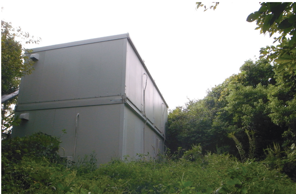
図 3. ナショナルコンポジットセンター建設のために建てられたプレハブ仮設工事事務所 (裏側). 写真は, 図 2 とほぼ同一地点から 2012 年 10 月 1 日撮影. ヒメボタルが飛翔していた場所の一部にプレハブが建てられている.