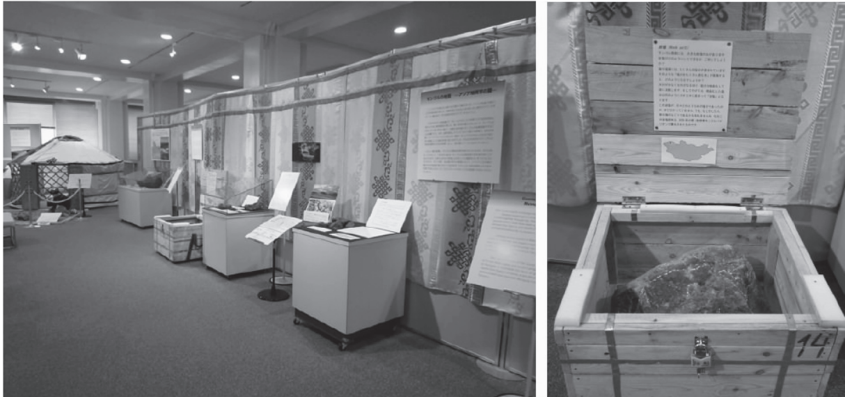
図 2 (左) ゲルの装飾用外張りで覆われたバンティアンパネル。(右) 輸送梱包用の木箱を使った展示。来館者が自分で木箱を開けて展示を楽しむ。

展には 13593 人の来館者があり、会期中にモンゴル科学技術大学からハムスレン MUST 付属地質博物館長、バトバヤル国際担当副学長、マンガラジャラブ電力工学部長が視察に訪れ、駐日モンゴル国大使館から、ソドブジャムツ大使とエルデネ副領事が来館した。その他、大相撲名古屋場所に合わせて大関の鶴竜関が来館し大きな話題となった。以下、本展で展示した解説資料等に基づき、展示資料および展示コーナーの様子について説明・紹介する。文章表現については、解説資料に即した形でとりまとめた。