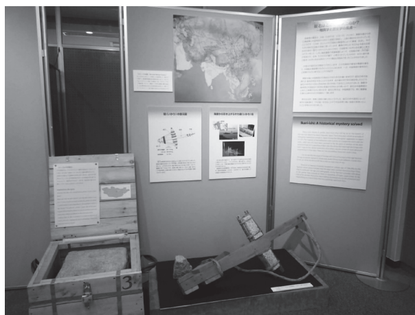
図 12 コーナー 9 「碇石はどこから来たのか？ —地質学と歴史学の接点—」の展示。写真左下の“木箱展示”は、モンゴルの花崗岩（モンゴル科学技術大学蔵）。

長崎県の鷹島は、元寇（弘安の役、1281年）のときに、朝鮮半島からきた東路軍と中国南部からきた江南軍が集結し、上陸の機会をうかがっていたところでした。この時、ほとんどの元寇船は暴風雨によって難破・沈没し、今でもその時の沈没船が海底に眠っています。鷹島の沖には、500 kg を超える長柱状の岩石（碇石）がたくさん沈んでおり、元寇船をつなぎとめる重りと考えられていました。しかし海底遺跡の発掘調査によって、元寇船の碇（木石碇）が発見され、従来“ただの石の重り”と考えられていたものが、40 m 級の長大船をつなぎとめる当時のハイテク製品の部品であったことが分かりました。