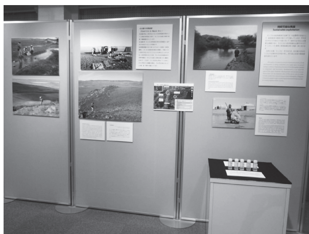
図 10 コーナー 6 「持続可能な発展」の展示。写真右下のプラスチックボトルは、モンゴルの鉱山地域の川の水試料（名古屋大学大学院環境学研究科山本鋼志研究室蔵）

モンゴルは鉱物資源の宝庫です。外貨獲得の手段として、鉱物資源の開発が急ピッチで進んでいます。平均月収が約2万円強のこの国において、国民の生活向上は重要な課題であり、そのために経済発展は必要不可欠です。しかし一方、開発と環境破壊は常に表裏一体にあります。自然の宝庫“モンゴル”を守るため、名古屋大学はモンゴルで法律を作る手助けをし、また鉱山地域の環境調査を進めています。