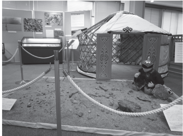
図7 コーナー4「ゴビ —資源と恐竜—」の展示。

モンゴル語で“ゴビ”とは、石ころがゴロゴロある砂漠のことです。東西約1600km、南北約970km、総面積は約130万km 2 。世界で4番目の大きさを誇るゴビは、気候が厳しいことでも有名です。ここでは夏は、非常に高緯度（北緯43度付近、日本の札幌市に相当）であるにもかかわらず最高気温が45℃を超える一方、冬は最低気温がマイナス40度を割り込むことも少なくありません。さらに、インド洋からの湿った空気がヒマラヤ山脈に遮られるため、非常に乾いた風が吹き付け、春は強い風が砂を巻き上げ強烈な砂嵐となります。