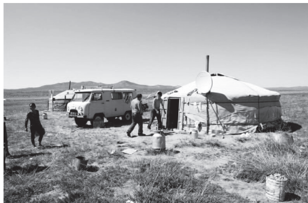
図3 ゲルとパラボラアンテナ。現代のゲルの多くは、太陽光発電装置とパラボラアンテナを備えている。中では電化製品が使用され、遊牧民はNHKの衛星チャンネルで大相撲中継を楽しんでいる。

モンゴル国は、中国とロシアの間にある、中央アジアの独立国です。内モンゴル自治区にもモンゴル文化を継承する人々がたくさん住んでいます。この“モンゴル文化圏の南半分”は「内モンゴル自治区」として中国の領土となっています。