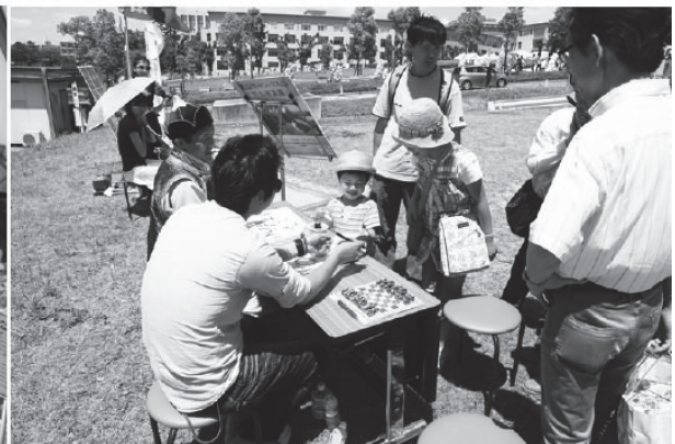
図17（左上）来場者にゲルの構造や装飾について説明するモンゴル人留学生。（左下）モンゴル衣装を着て来場者を迎える留学生。（右上）シャガー、モンゴルチェスの指導。（右下）モンゴル書道教室。