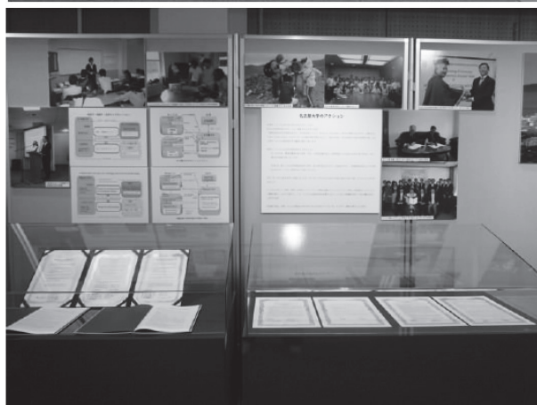
図 11 (上) コーナー 7 「モンゴルの都市問題」の展示。(下) コーナー 8 「名古屋大学のアクション」の展示。写真下半は、名古屋大学とモンゴル各大学との学术交流協定書、および学生交換覚書。