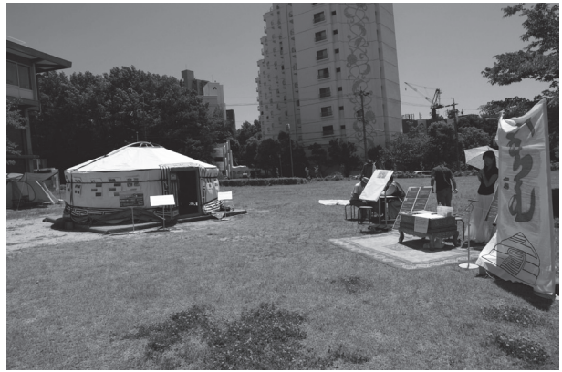
図16 関連イベント「モンゴル人学生による名大祭企画」。サテライト展示1のゲルの周囲で、モンゴル文字教室、シャガーやモンゴルチェスの指導、モンゴル民族衣装の試着、ゲルとモンゴルの民俗・文化の紹介等、多彩なイベントが実施された。

名大祭期間中の6月10日に、サテライト展示のゲル周辺で、在名モンゴル人留学生によるイベントが実施された。モンゴル文字や、シャガー（羊の踝骨を使った占い）、モンゴルチェス等の紹介が行なわれ、またモンゴル医療向上のためのNGO団体「Save Infant」の紹介も行われた。