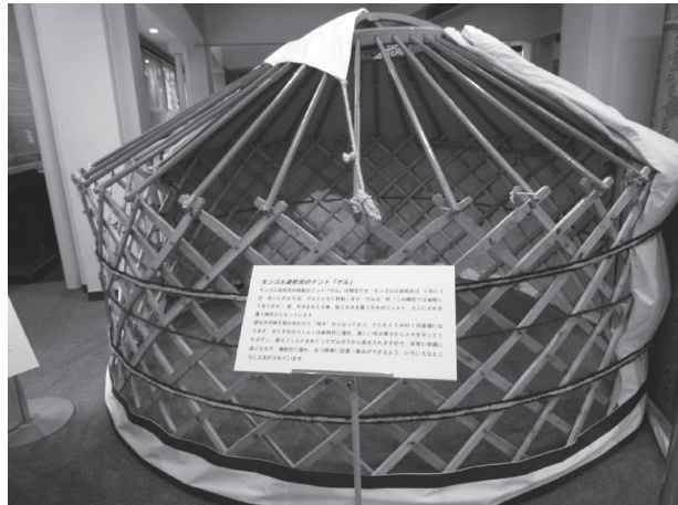
図13 サブコーナー1「ゲルの構造」の展示。

晶洞ではしばしば、展示の水晶のように、結晶は非常に大きく成長します。テレルジで見つかった最も大きな水晶は、長さが数mもあったそうです。しかし残念なことに、トラックでウランバートルに運ぶ途中、落として割れてしまったそうです。