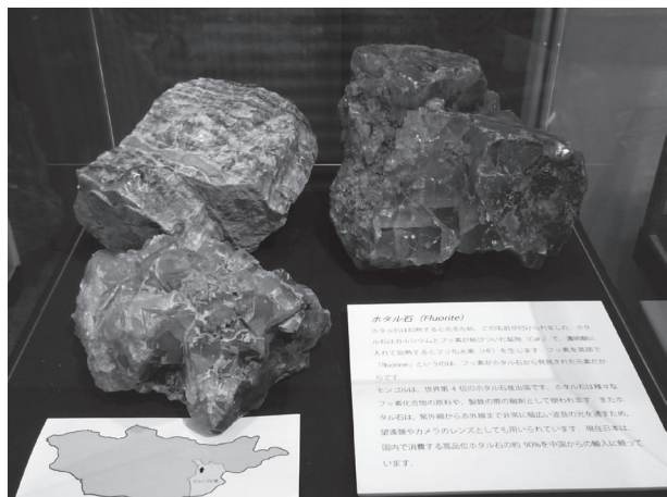
図14 サブコーナー3「ホタル石」の展示（モンゴル科学技術大学蔵）。