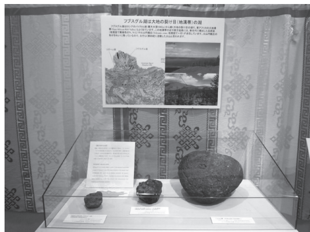
図6 モンゴル中央部で産出した火山弾の展示（モンゴル科学技術大学蔵）。

Although there is rarely volcanic activity in the center of continental masses, in Cenozoic times there was a volcano in the western part of Mongolia, the center of the Eurasian continent. As tectonic movements force continents to spread, the pressure from below forms volcanic hot spots. This volcanic rock demonstrates the breaking-up of Eurasian continent.