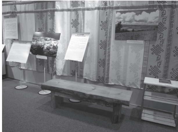
図4 コーナー1「モンゴルの自然」の展示の様子。

一方、モンゴルの冬は猛烈な寒さです。去年の冬は、首都ウランバートルでさえマイナス40度を下回りました。外に出た瞬間にまつげが凍って目が開けられず、肌を長時間露出すると凍傷になります。このような極限の地で、人々は必死に生きています。