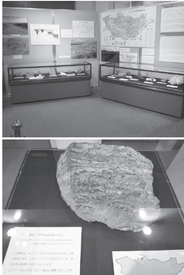
図9 (上) コーナー5「鉱物資源の宝庫『モンゴル』—外資との戦い—」の展示、(下) フブスグル県で産出したリン鉱石の展示(モンゴル科学技術大学蔵)。

Central Asia is an undeveloped treasure trove of mineral resources which are in great demand by industry across the globe. Rare Earth elements, which are particularly sought after for electronics, can be expected there. As a matter of national policy, Japan's Agency of Natural Resources and Energy and the Japan Oil, Gas and Metals National Corporation handle