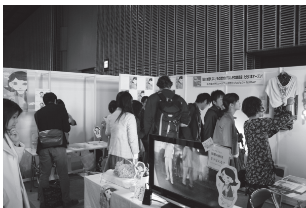
図2 サイエンスアゴラ出展企画のもよう。3×4mのブースである。手前の大型モニタは赤外線カメラで通路を映している。右奥は布製品をポータブルデバイスで観察している。中央奥は赤外線透過実験で絵画を観察している。左奥の受付で参加者のカメラ付き携帯電話に赤外線透過フィルタを装着している。

本ブースでは、「虹の縁には何がある？ 身近な光を大分解！」と称し、プリズムで分散させた太