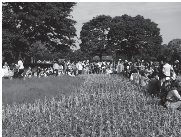
図1 金環日食観望会時の会場のもよう。太陽の方向は右斜め後方。多くの参加者が花壇の縁に座って観察している。奥のテントは3D シミュレーション等のブースである。