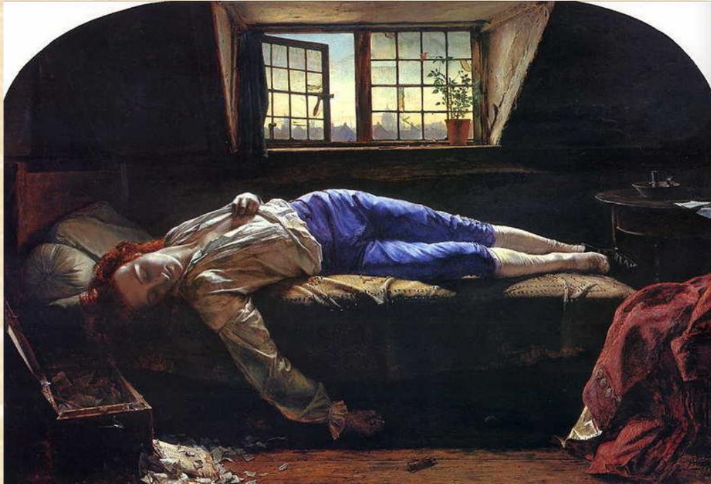
Henry Wallis, "The Death of Chatterton" (1856)