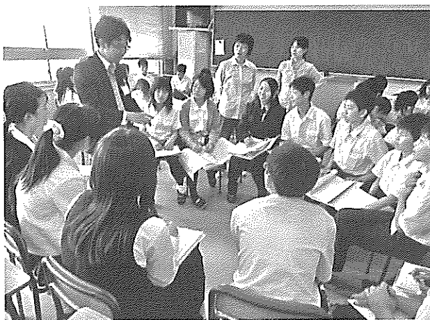
教育実習生にインタビュー

授業では毎回学習目標を設定し、ワークシートを全員に提出させ、点検の上返却した。生徒は毎回の授業のプリントやワークシートを各自でファイルにまとめて記録を残した。また、生徒はこの一年間の学習を研究集録の形でレポートにまとめ、自分の考えを持って、クラスで発表し、研究調査活動を通して得た情報を互いに共有することができた。最終回のアンケートで、生徒は入学当初と比べて調査研究の基本的なスキルが身についたと実感できる結果が出た。