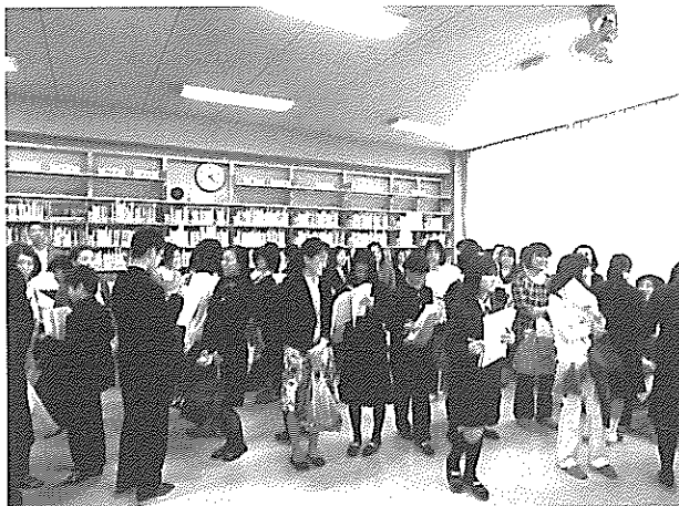
保護者にインタビュー