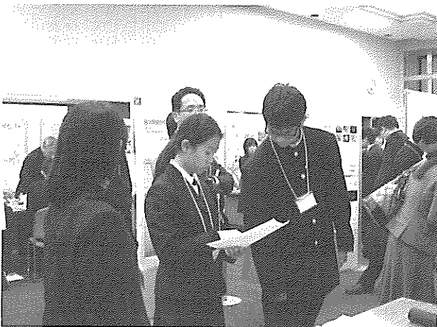
数学プロジェクト