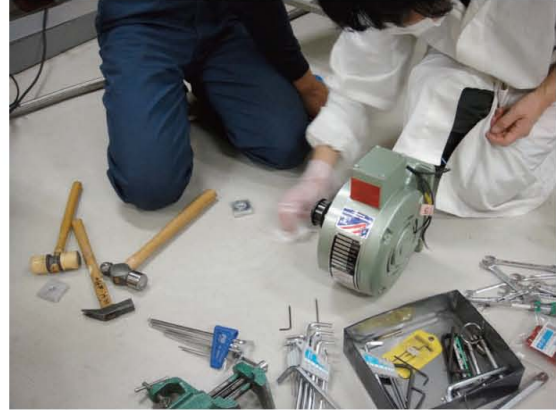
写真5 加速器タンク内の発電機の交換