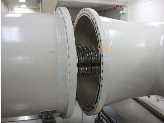
写真4 加速器タンク内の保守のためのタンクの解放

にも、2回目の放電が発生した。こうした中、12月15日から12月16日にかけて、 ^{14}\text{C} 測定テスト実験を行いほぼ満足出来る結果が得られたため、引き続き \text{SF}_6 ガスの脱水を実施しながら、12月20日から試料の ^{14}\text{C} 測定を始めた。ターミナルの発電機は、その後、異常もなく順調に稼働している。