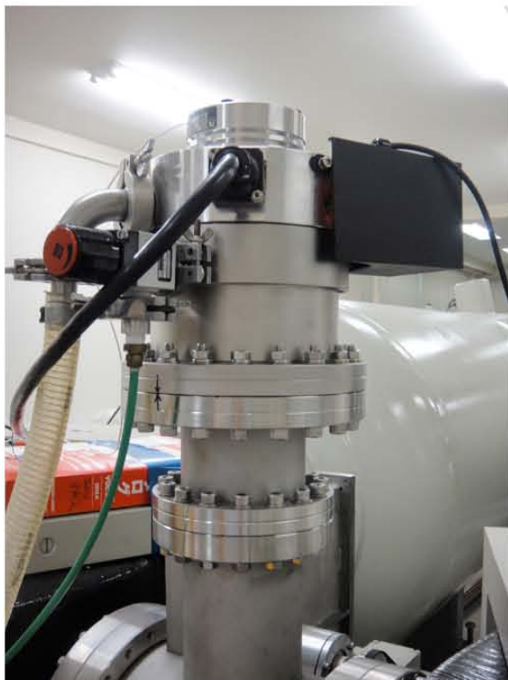
写真3 リコンビネーター部に組み込まれているターボ分子真空ポンプ