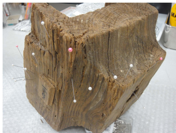
写真 9 台座木材の年輪計数