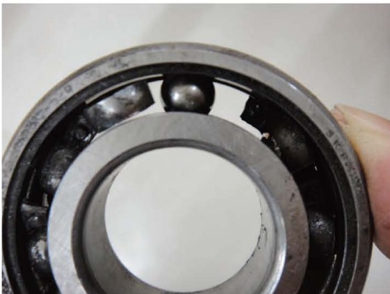
写真6 使っていた発電機のボールベアリングの破損状況