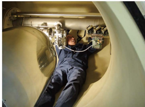
写真7 加速器タンク内での発電機の交換風景