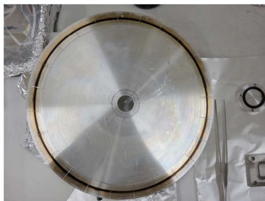
写真2 Chopper wheel