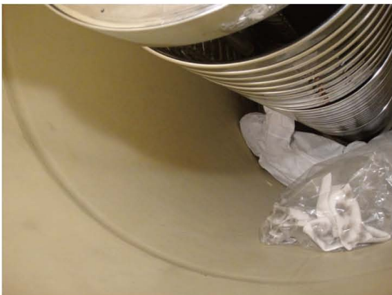
写真8 加速器タンク内の整備