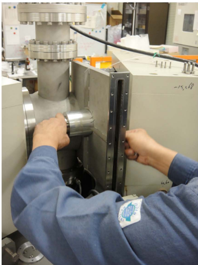
写真1 リコンビネーター部にある chopper wheel のハウジング。中央部に立てに wheel が設置される。左手部が ferro-fluid feedthrough