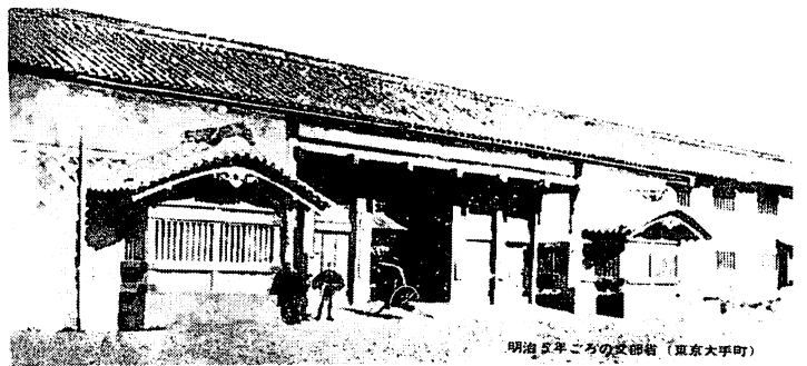
明治5年ごろの文部省（東京大手町）

この文部省設立の布達から、廢藩により藩費で学んでいた生徒と藩校が問題になることを危惧していることが読み取れる。ここでは「元來學問之儀ハ人民一日モ缺ク可ラサル事」として、人民に學問の必要性を述べ、そのために文部省を設立し