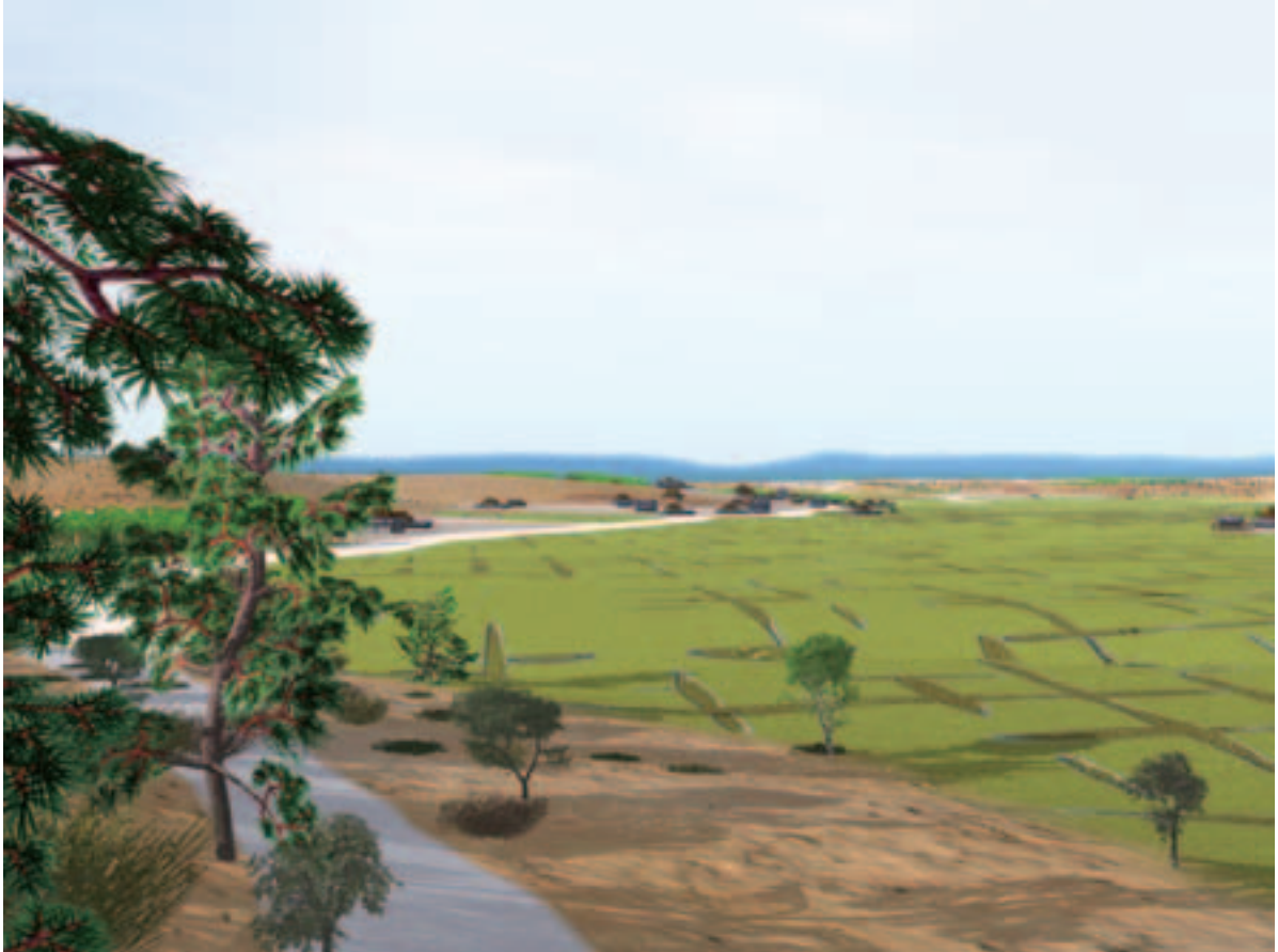
図6 星ヶ丘、東山公園付近から西の城山方向

たことを示している。宝永から140年ほど後の天保、弘化の時代も、御林として保護されつつ主にマツの伐採と再生がくりかえされ、景観はそれほどの違いはなかったであろう。天保の頃の植田山は、天保六年二月の「植田山追狩」の図（『名陽見聞図会』）に画かれているようにマツが優占する山林であったろう。明治はじめの改革期に、これらの御林からトチ、ハンノキやマツの大木の盗伐が行われた。つかまった者は桃巖寺に集められ、「九平」という名の巡査が盗んだ木の本数に応じて尻を打ったという話が記録されている（『星ヶ丘よもやま話』）。現在の名古屋東部丘陵地帯にはトチやハンノキ、マツタケは分布していないかひじょうにまれである。