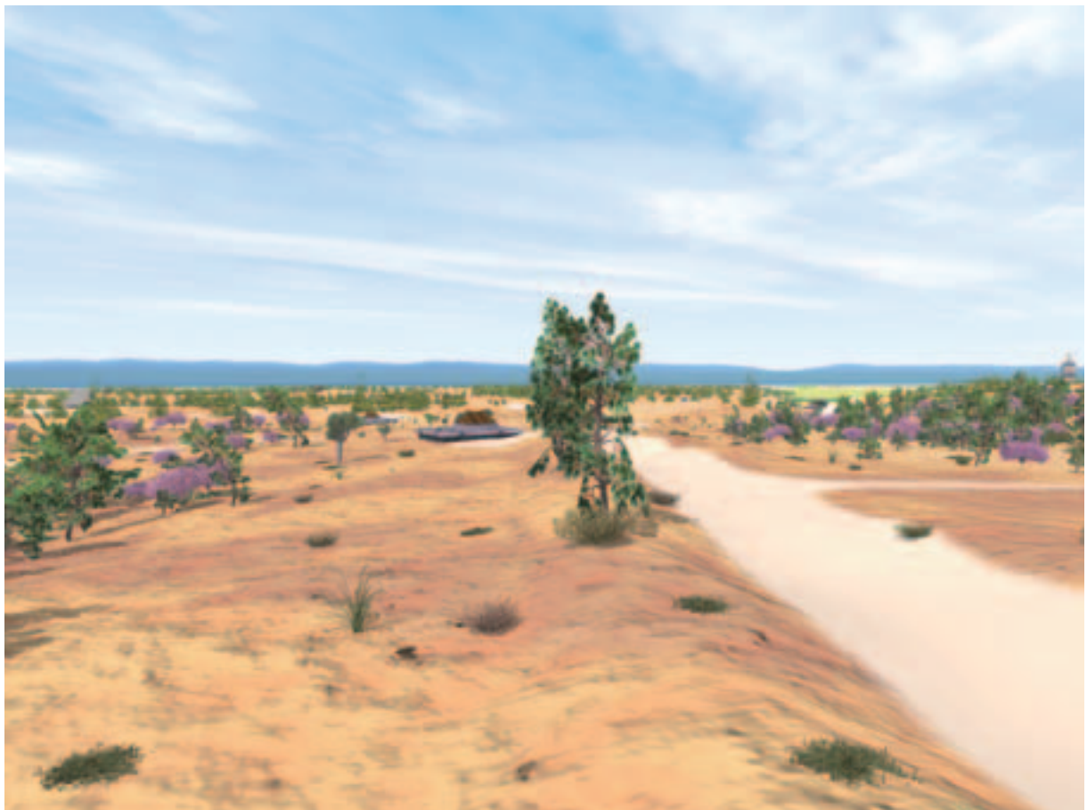
図2 八事-末森御林道八事口から八事山興正寺方面

この再現景観図に向かって手前から向こう(東から西)へ通る駿河町街道の右側(北側)に八事-末森御林道八事口が見える。この一帯は、寛政年間愛知郡村邑全図の内「八事庄八事村絵図」、天保十二年および弘化四年「愛知郡八事村絵図」によると、小松生の平松山および定納畑と記されており、畑または樹高の低いマツの疎林であったため見通しはよかったであろう。定納山、定納畑あるいは平山とは民有林あるいは畑地として使用を認められていた林域で、人々は年貢や冥加金を払って薪、芝や秣、屋