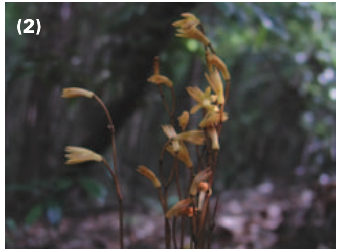
図1，2. 名古屋大学で発見したエンシュウムヨウランの株全体の写真（1）と花序の写真（2）

報告」(1940)が最も古いものとなる。これは、初代洪沢総長の「緑の学園」構想のために、新敷地が設定された後に大学当局から依頼されて行われたものであり、この報告を元に当局は植樹を行い、風致ある大学作りをしてきたようである(神谷2003)。その目的のため、報告では植生を対象とした細かな解析、研究はなされていない。