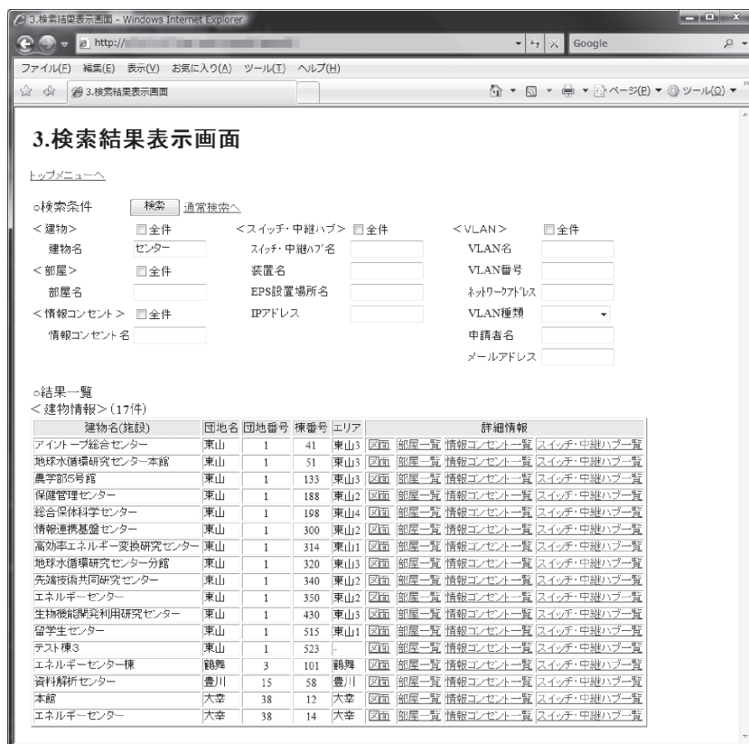
図2 検索画面例（建物詳細検索）

所、スイッチ・中継ハブ、部屋、VLANを対象とする検索が行えるようになっています。