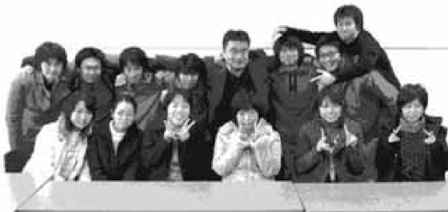
図6 最後の授業での記念撮影

えている原因の一つは、インタビュー計画の不十分さにあるように思われる。筆者の判断ミスは、このインタビュー計画の発表を成績評価の対象に含めなかったがために、グループによって水準の差が大きくなってしまったことである。形成的評価を重視するのであれば、当然ながらインタビューに至るプロセスである計画立案も評価の対象とすべきであったろう。